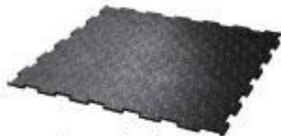
Belmondo Classic Art. 8060 - 1000x1000x18 mm 4-seitig gepuzzelt Farbe schwarz - Hufeisenprofil