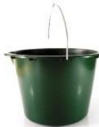
20 Liter Eimer mit Bügel Artikelnummer 7610 Höhe in mm: 270 Durchmesser in mm: 380 Material PE-HD Farbe: grün