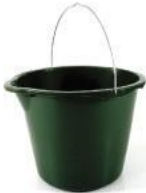
12 Liter Eimer mit Bügel Artikelnummer 7600 Höhe in mm: 225 Durchmesser in mm: 310 Material: PE-HD Farbe: grün