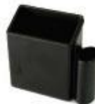
Art. 6100 Höhe in mm: 74 Länge in mm: 80 Breite in mm: 29 Material: PS Farbe: schwarz, grün, blau oder natur/weiss