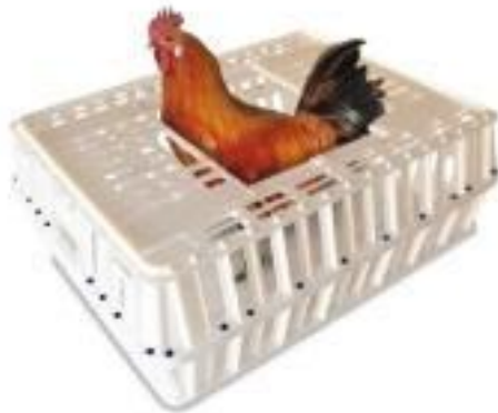
Geflügeltransportkiste Art. 3000 Länge in mm: 850 Breite in mm: 660 Höhe in mm: 300 Material: PE-HD Farbe: natur/weiss Verbindung: Nieten aus PA Mit Schiebetüren, verstärkte Ecken und Boden