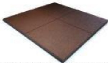
Elastikmatte 1000x1000x30 mm Art. 8101 - Hohe Verdichtung Wasserdurchlässigkeit: gering Verbindung: Systemstifte Farbe: rot/braun