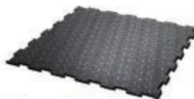
Belmondo Trend (Luftpolster) Art. 8070 - 1000x1000x28 mm 4-seitig gepuzzelt Farbe: schwarz - Hufeisenprofil