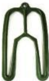
Art. 6000 Höhe in mm: 270 Breite in mm: 130 Dicke in mm: 10 Material: PE-HD Farbe: grün