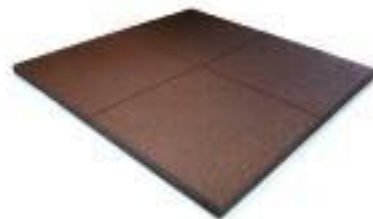
Elastikmatte 1000x1000x45 mm Art. 8111 - Hohe Verdichtung Wasserdurchlässigkeit: gering Verbindung: Systemstifte Farbe: rot/braun