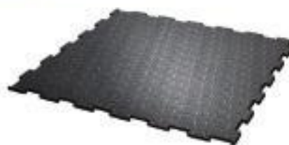
Belmondo Basic Art. 8050 - 1000x1000x18 mm 4-seitig gepuzzelt Farbe: schwarz - Hufeisenprofil