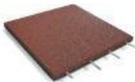
Elastikmatte 500x500x45 mm Art. 8121 - Hohe Verdichtung Wasserdurchlässigkeit: gering Verbindung: Systemstifte Farbe: rot/braun