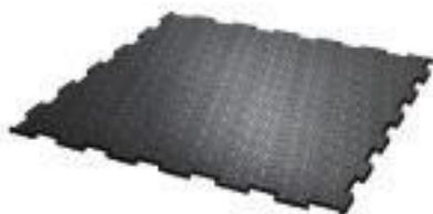
Belmondo Walkway Art. 8040 - 1000x1000x12 mm 4-seitig gepuzzelt Farbe: schwarz - Hufeisenprofil