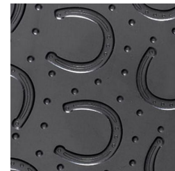
Hufeisenprofil mit Deckschicht