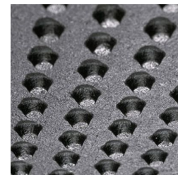
Noppen an der Unterseite

* Bitte beachten Sie die entsprechenden Vorgaben und Montageanleitungen mit wertvollen Hinweisen und Tipps.